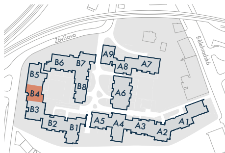
SEKCE B4 • SECTION B4