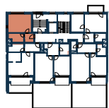
1.NP • 1ST FLOOR