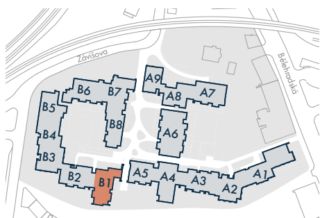
SEKCE B1 • SECTION B1