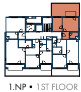
1.NP • 1ST FLOOR