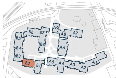
SEKCE B2 • SECTION B2