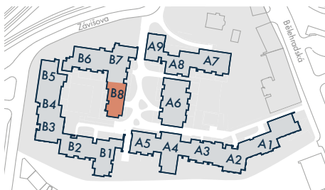
SEKCE B8 • SECTION B8