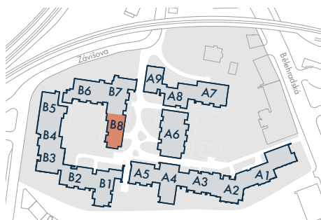
SEKCE B8 • SECTION B8