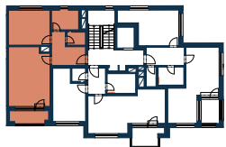
2.NP • 2ND FLOOR