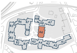
SEKCE A6 • SECTION A6

Orientační hrubý rozměr kótovaný v mm (kótováno na zdivo bez omítky) • Approximate rough dimension dimensioned in mm (dimensioned for masonry without plaster)